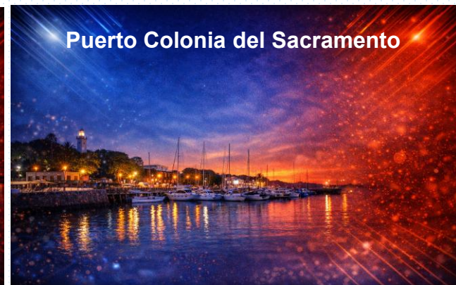
Puerto Colonia del Sacramento