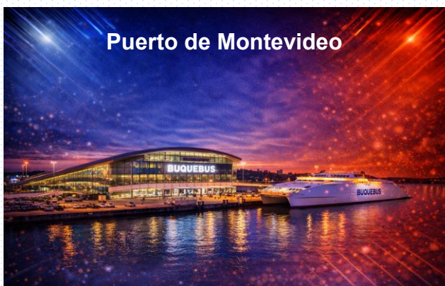
Puerto de Montevideo