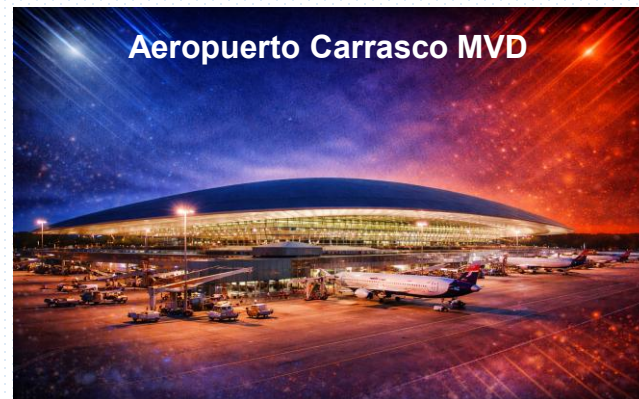
Aeropuerto Carrasco MVD

Montevideo es un destino fácil y cercano . Llegar y moverse es simple: el Aeropuerto Internacional de Carrasco conecta con vuelos nacionales e internacionales; la Terminal Tres Cruces concentra los ómnibus de todo el país y la región; las terminales fluviales de Montevideo y Colonia del Sacramento permiten el cruce rápido desde Buenos Aires, con combinación directa a bus; y el ingreso en auto por las fronteras es ágil y accesible. Todas las opciones están disponibles, y las distancias cortas hacen que todo quede a pocos minutos.