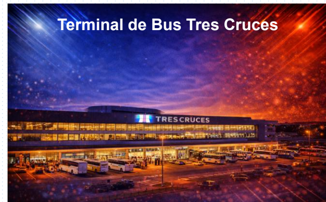
Terminal de Bus Tres Cruces